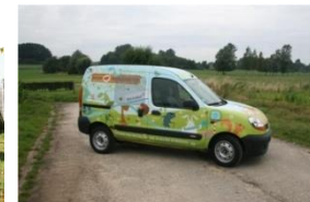
VE, PHVE (tests de flottes)