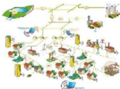
Production locale et décentralisée d'électricité et "Smart grid"