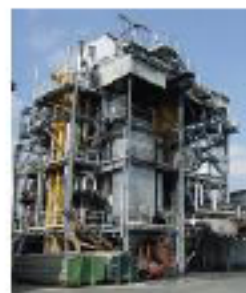
Production d'énergie à partir de biomasse