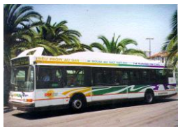
Transport public (Bus GNV)