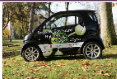
Mobilité durable (GNV, biométhane, VEs, services, etc.)