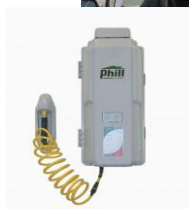
Véhicules de Flottes (VL et VUL GNV)