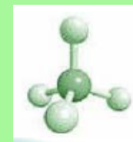
Biocarburants gazeux & mélanges (biomethane, Hythane®)