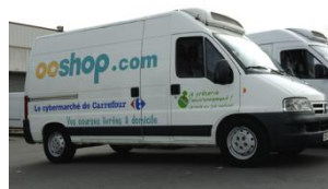
Transport de marchandises (PL GNV)