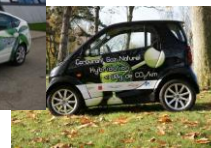
Hybrides (Prius GNV, Smart)