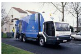
Propreté urbaine (BOM GNV)