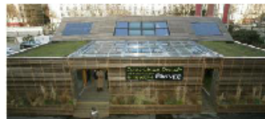
Efficacité énergétique des bâtiments