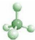
Traitement/valorisation des déchets (déchets organiques, biogaz, eau, etc.)